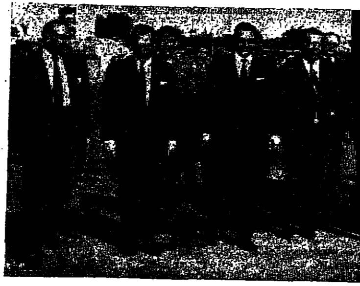
السيد رئيس الوزراء وبعض الوزراء ونائب رئيس الوزراء وبعض الوزراء...